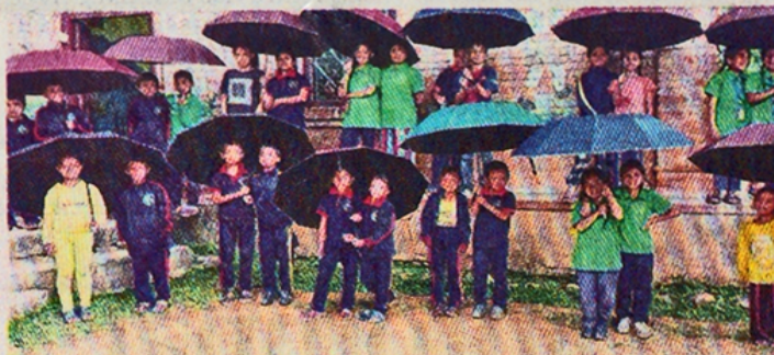
Distribution de parapluies aux élèves des cours de soutien scolaire à Panauti.

L'année 2022-2023 - de mi-juillet à mi-juillet pour respecter l'année fiscale népalaise - a été particulièrement riche en actions sur le terrain pour l'association Alsace-Népal. Outre les bourses d'étude, les subventions de postes d'enseignants, les cours de soutien scolaire, en collaboration avec Himali Saino Foundation (HSF), association népalaise partenaire, diverses actions ont été menées. Des fournitures scolaires et des équipements ont été distribués aux élèves :