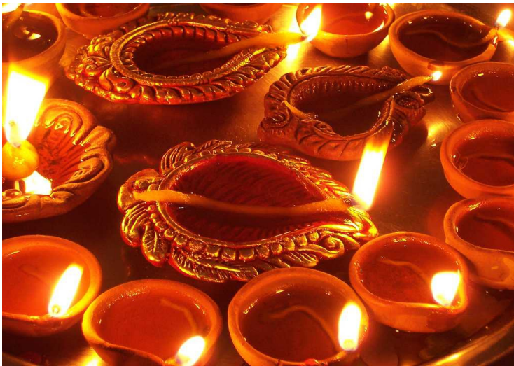
Lampes à huile et rosaces de couleurs décorant les rues et les maisons.

Novembre : La fête de Dashain s'est terminée le 17 octobre et les élèves ont pu reprendre les cours, mais que pour deux semaines. En effet, à l'occasion de la fête de Tihar, qui s'est déroulée cette année du 3 au 7 novembre, les élèves ont à nouveau bénéficié de vacances. Tihar ou Dipawali, le festival des lumières et de la couleur, marque la nouvelle année pour les Newars. En dépit de l'interdiction gouvernementale, des pétards et des feux d'artifice avaient illuminé le ciel.