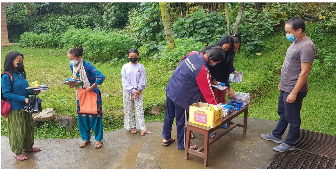
Bibhisan distribue les fournitures scolaires au PCH